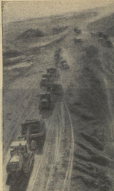
Река потечёт в гору... «Разве так бывает?» — удивитесь вы. Бывает! Канал Иргыш — Карасанда действительно идёт в гору. Вода нужна металлургическому комбинату, а по пути она должна напоить сухую степь. И для того чтобы бежала вода всё выше и выше, строят на канале плотины. Строительство одной из них вы и видите на снимке.

В. ТАРАСОВ, журналист. Красноярский край, Обь-Енисейский канал.